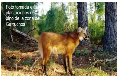
Foto tomada en plantaciones de pino de la zona de Garruchos

Los impactos ambientales de la cosecha se controlan fragmentando las áreas bajo intervención en áreas relativamente pequeñas de menos de 50 ha permitiendo así que la fauna que prosperaba en estas áreas busque refugio en otras cercanas. Como consecuencia las áreas de nuevas plantaciones también quedan fragmentadas resultando un conjunto de lotes disetáneos. La erosión de suelos se previene por un lado como resultado de la misma plantación en curva de nivel y por otro demarcando los sentidos de arrastre para la extracción. Uno de los impactos potencialmente más importante derivados de las plantaciones puede ser la contaminación con fitosanitarios